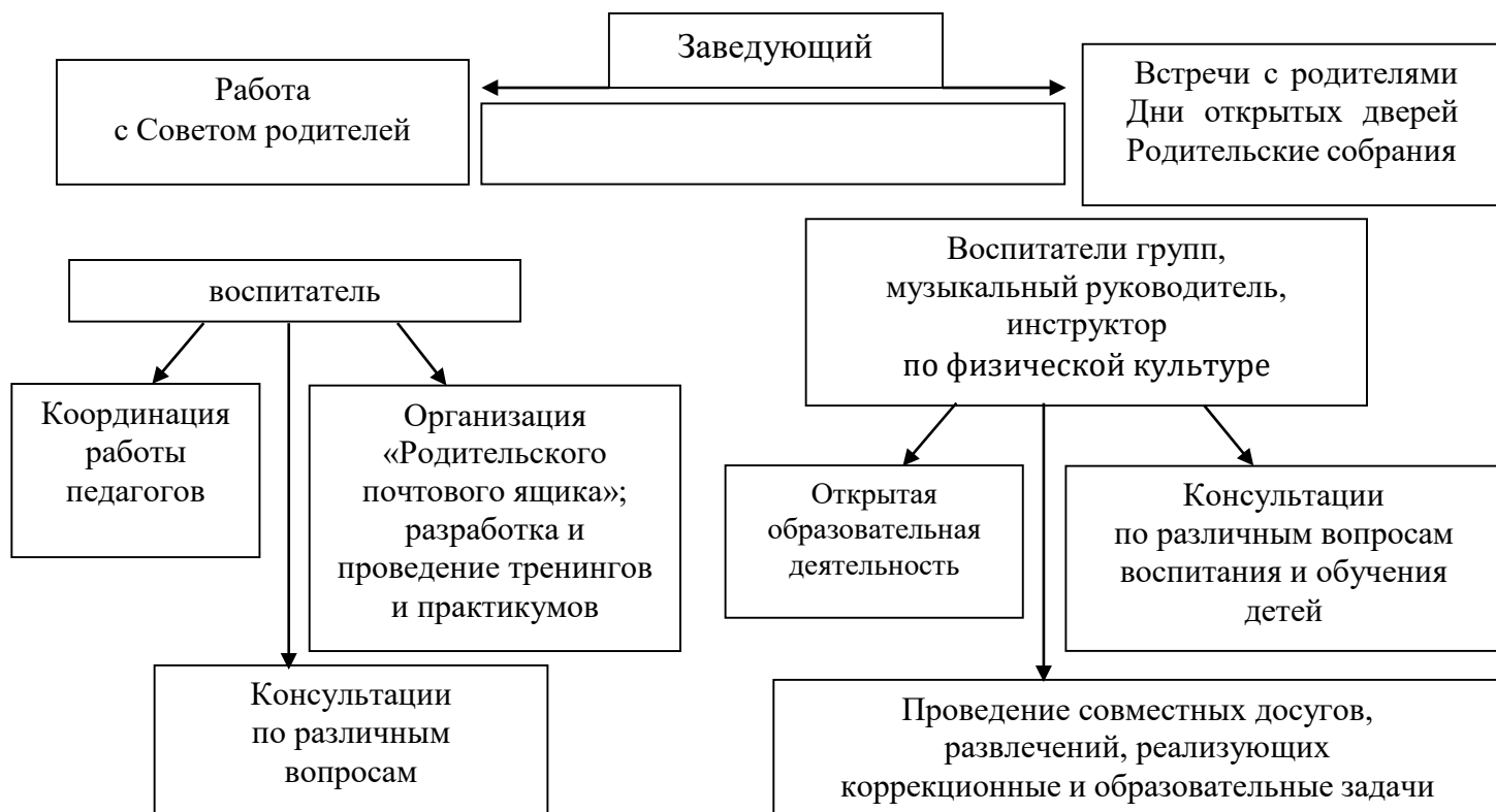
Схема взаимодействия с семьями воспитанников